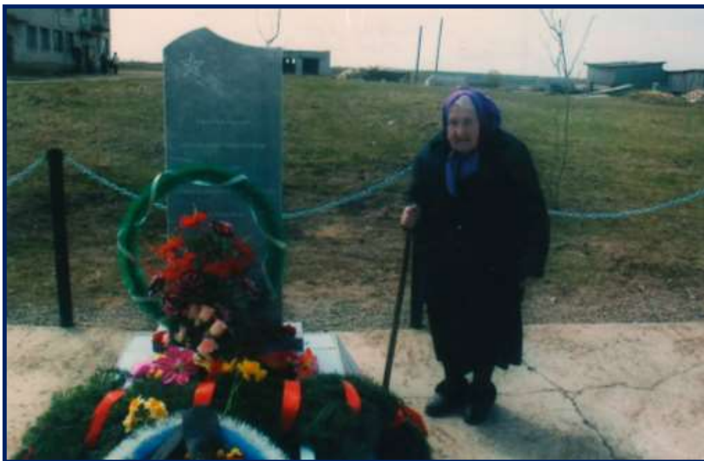
У обелиска Победы