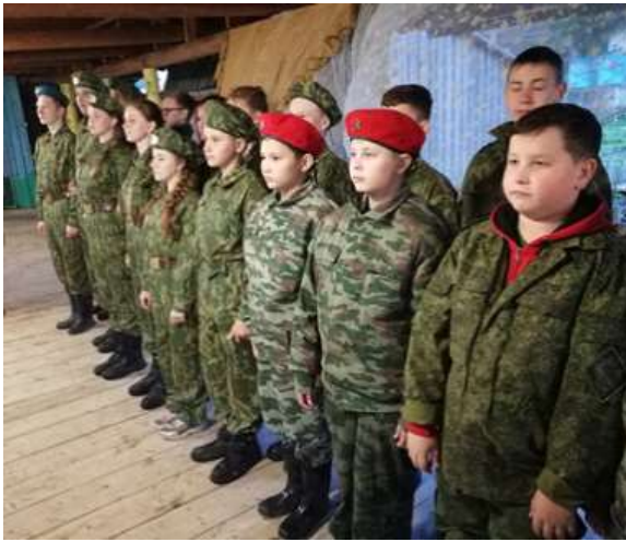
Юнармейцы в сборе