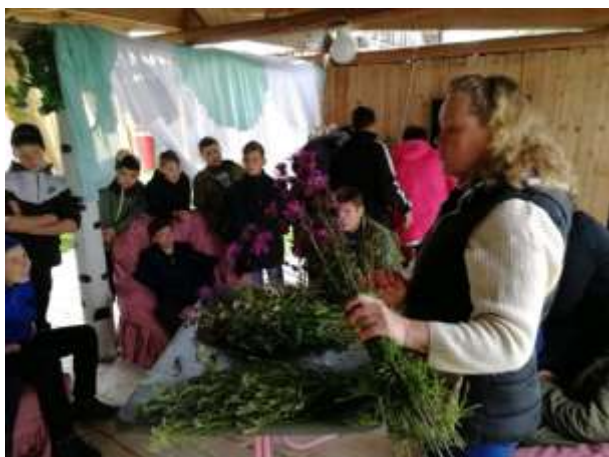
Мастер-класс по травоведению и цветочной аранжировке