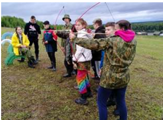
Мастер-класс по стрельбе из лука