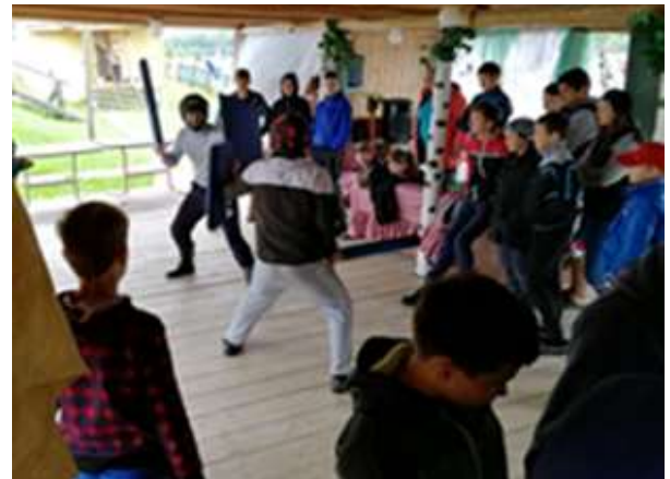
Мастер-класс по владению древнерусским оружием (меч, лук).