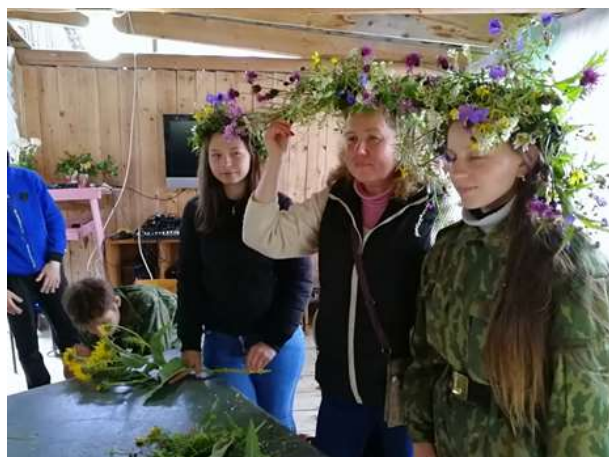
Мастер-класс по плетению венков из цветов