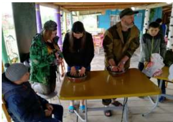
Мастер-класс по приготовлению чая из кипрея узколистного