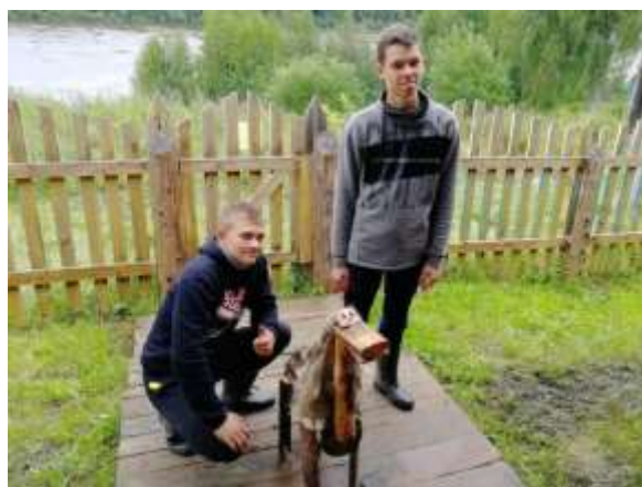
Изготовление арт-объекта «Конь»