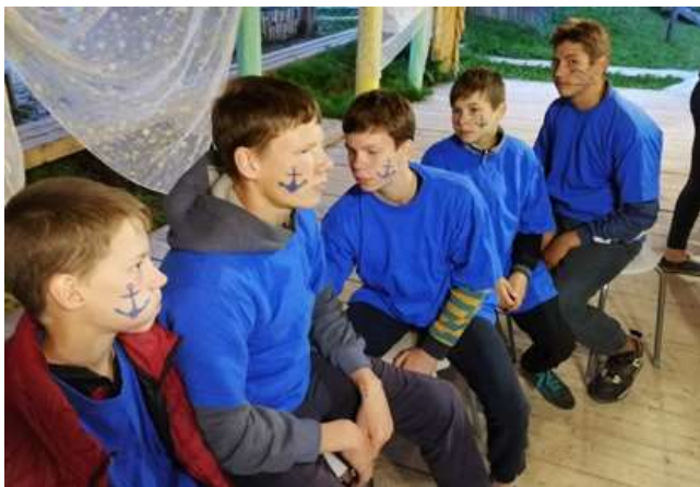
Участники флеш-моба «Яблочко»