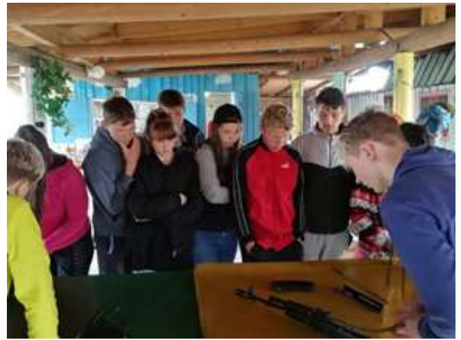
Мастер-класс по разборке-сборке автомата