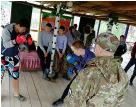
Мастер-класс по рукопашному бою