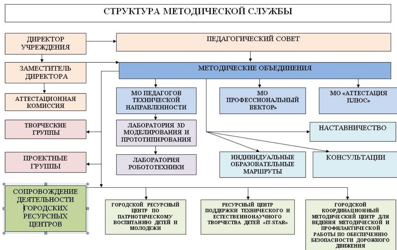
Рис.3 Структура методической службы

Структура методической службы определяется стратегией развития Учреждения, моделью организации образовательной деятельности Учреждения и включает следующие компоненты: