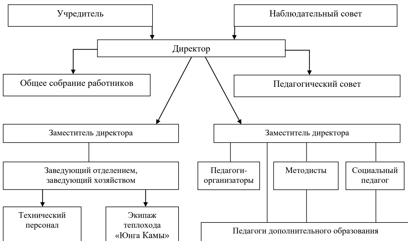
Рис.2 Организационная структура МАУ ДО ДЮЦ «Каскад»

Непосредственное руководство учреждением осуществляет администрация в лице директора и его заместителя, в подчинении которых находятся педагогический и обслуживающий персонал. Формой взаимодействия администрации и коллектива является обмен информацией, индивидуальные собеседования, совещания при директоре или его заместителе, заседания педагогического совета и общего собрания работников Учреждения, на которых каждому предоставляется право принять участие в решении и исполнении тех или иных вопросов по оценке результативности, действенности, качества образовательного процесса и работы Учреждения в целом.