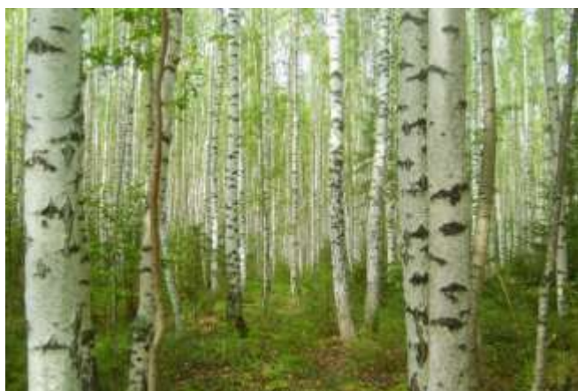
Фотография «Березовый край»

Простые слова? Разве кто-то поспорит? Ну, разве что в шутку кто подзадорит, Я знаю одно – нет важнее тех слов, Ведь это всей жизни основа основ.