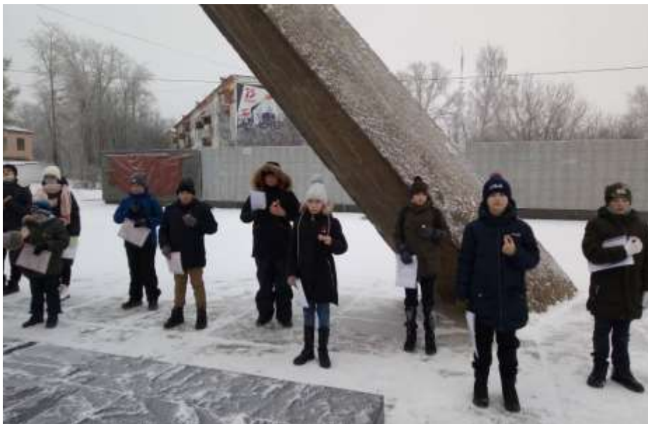
На фото вступление в отряд ВВПОД «Юнармия» на городском «Мемориале Победы»

Потомки тех славных солдат, Мальчишки сегодняшних дней, Пусть память о них сохранят, Пусть вечно сверяются с ней.