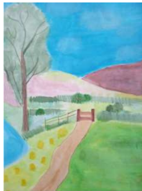
Рисунок «Родной край» (пос. Зырянка – место, где живет моя семья), акварель.