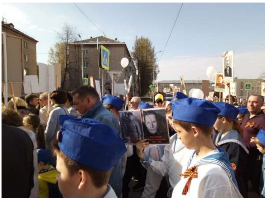
Участие в акции «Бессмертный полк»

Все их поздравляют с Праздником Победы, Дарят им гвоздики в память той войны. Чтобы снова встретить ясные рассветы, Помнить эти годы мы с тобой должны!